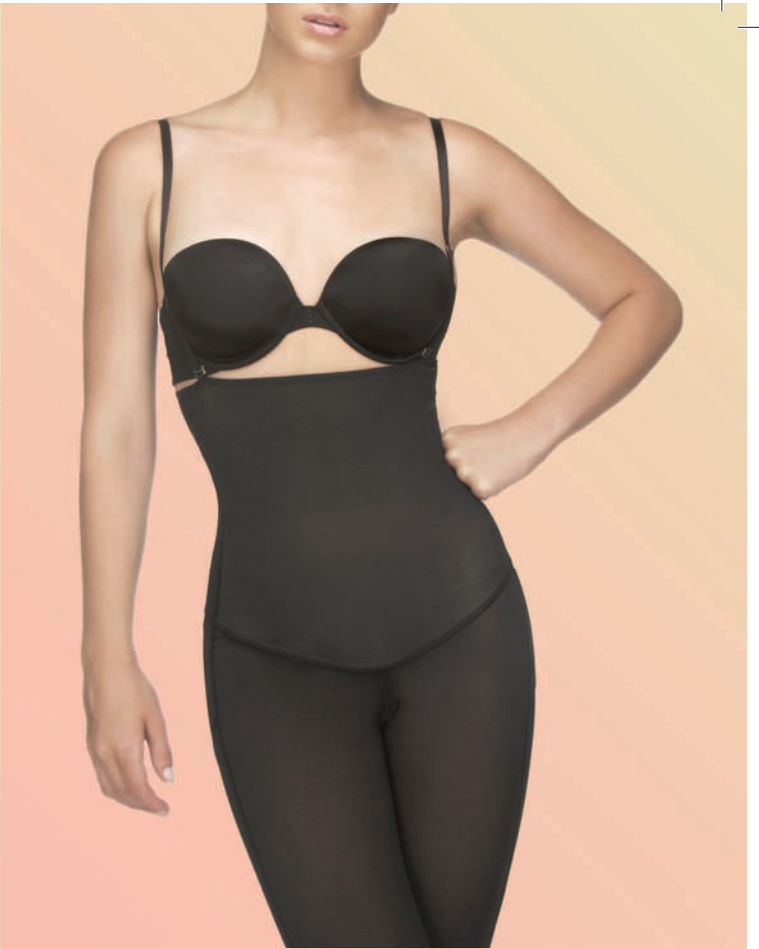
PAULE REF 316. enterizo con cierre lateral y estilo strapless. (Debajo de la rodilla). ROSELLE REF 317. enterizo estilo strapless. (Debajo de la rodilla). NICOLETTE REF 321. enterizo alto de espalda. (Debajo de la rodilla). ALAINA REF 324. enterizo estilo strapless. (Capri)